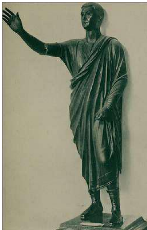
L'Arringatore, probabile statua di Aulo Metello.

https://www.flickr.com/photos/internetarchivebookimages/14763676324