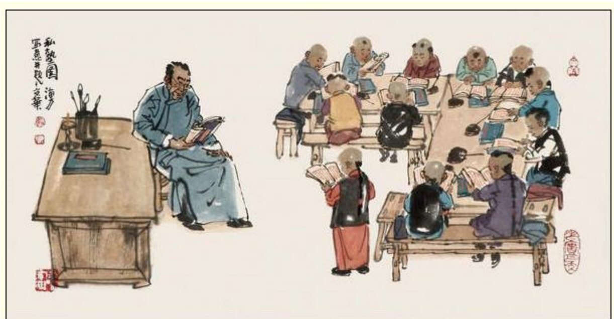
Una classe nella antica scuola cinese