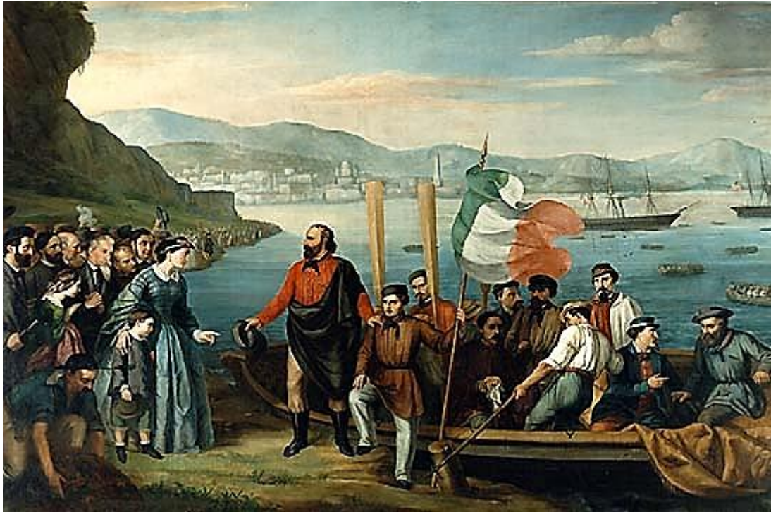
Autore sconosciuto: La partenza da Quarto.

La mia impressione è che in questa immagine, che si ritrova assai frequentemente (non esclusa it.wikipedia ), la riproduzione scambi la sinistra con la destra. Infatti si trovano, in assai minor numero, anche riproduzioni dello stesso quadro in cui il mare con le navi è a sinistra e lo scoglio a destra, ciò che mi sembra più corretto. Si confronti con il quadro dell'Induno, riprodotto all'inizio.